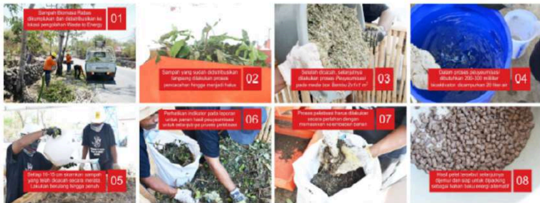
Gambar 2. Proses Pengolahan Biomassa/Residu Biomassa Menjadi Bahan Bakar