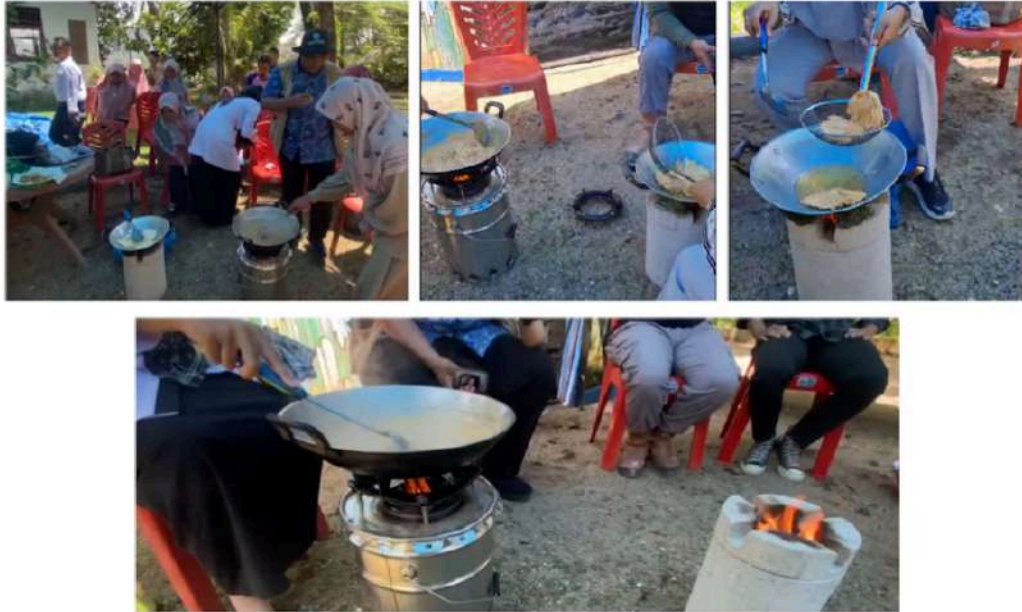
Gambar 4. Uji Coba Penggunaan Tungku Biomassa Berbahan Bakar Biopellet di Kebun Buah Kandi, Kota Sawahlunto, Provinsi Sumatra Barat

terkumpul dari masyarakat untuk dikirimkan ke PLTU Ombilin dan digunakan sebagai bahan bakar alternatif pengganti batu bara. PLTU Ombilin yang berlokasi di Desa Sijantang, Sijantang Koto, Talawi, Sumatra Barat. Lokasi tersebut berada sejauh \pm 15 km dari pusat Kota Sawahlunto. Kapasitas pembangkit listrik sebesar 2 x 100 MW dengan tipe boiler pulverized . Bahan bakar yang digunakan adalah batu bara yang sudah dihaluskan menjadi bentuk serbuk ukuran 200 mesh . Dengan karakteristik penggunaan bahan bakar berupa serbuk batu bara, maka penggunaan arang biomassa/biochar halus lebih ideal dibandingkan penggunaan bahan bakar biomassa nonkarbonisasi dalam proses co-firing di PLTU.