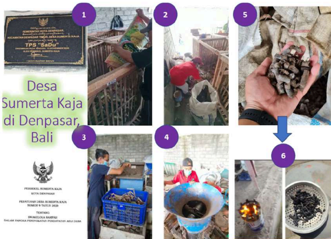
Gambar 3. Proses Pengolahan Biomassa/Residu Biomassa di TPS SaDu Desa Sumerta Kaja, Kota Denpasar, Provinsi Bali