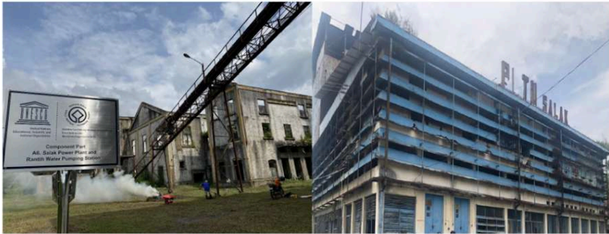
Gambar 6. PLTU Salak di Sawahlunto

tentu memerlukan perizinan, dan tidak boleh mengubah nilai sejarahnya. Jika dahulu dari bangunan tersebut dihasilkan energi listrik untuk kebutuhan pengolahan batu bara dan kebutuhan listrik Sawahlunto, maka dengan mengubahnya menjadi Pusat Pengolahan Biomassa akan menghidupkan kembali aktivitas di sana yang terkait dengan pemenuhan energi. Gambar berikut menampilkan kondisi terkini dari PLTU Salak.