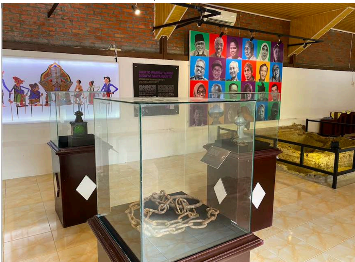
Rantai yang digunakan orang rantai. Dipajang di Museum Goedang Ransoem

Selain narasi orang rantai, pemandu juga mengarahkan rombongan pada salah satu koleksi yang juga tampak mencolok: Wayang Sawahlunto. Lewat koleksi wayang itu, pemandu memulai kisah tentang keberagaman etnis dan budaya di Sawahlunto. Narasi keberagaman ini kembali muncul di ruangan selanjutnya di gedung yang berbeda. Di sini dipajang pakaian adat dari beberapa etnik yang mendiami Sawahlunto, etnik Minang, Batak, Jawa, dan Tionghoa.