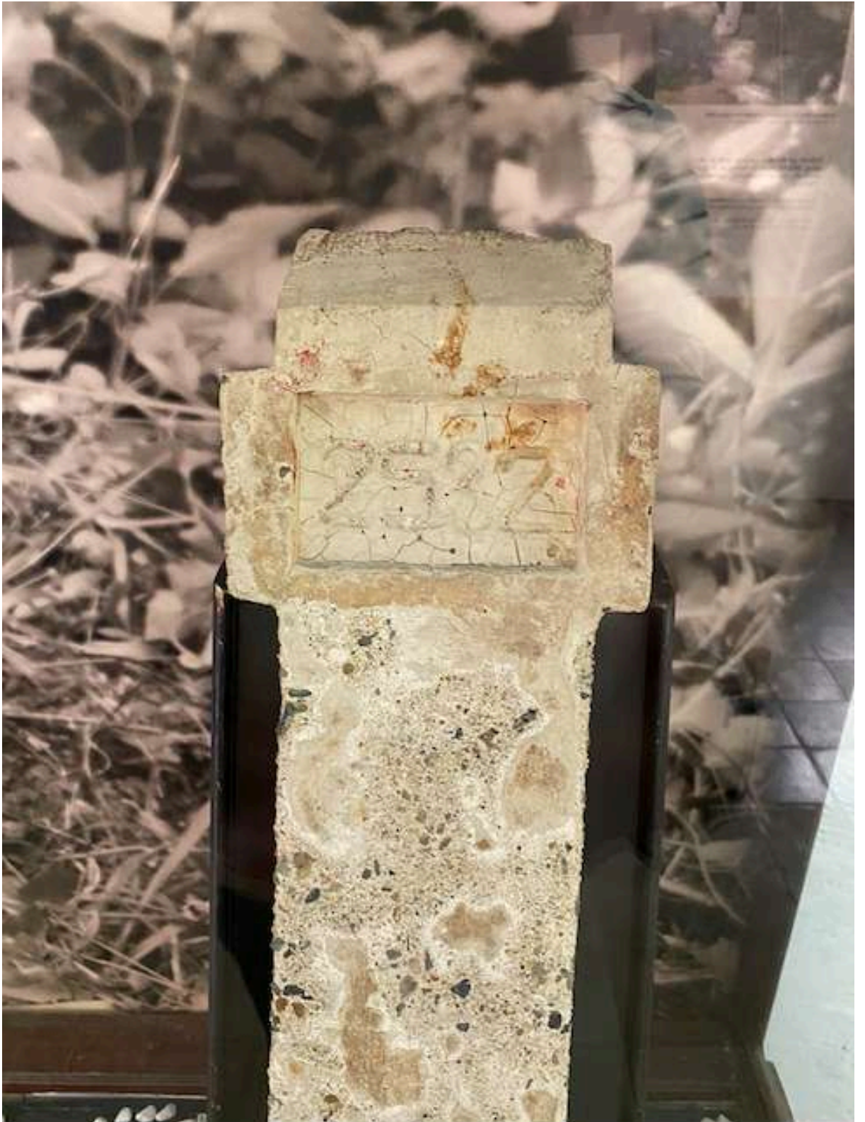
Batu nisan Orang Rantai dengan nomor registrasi tanpa nama asli. Dipajang di Museum Goedang Ransoem