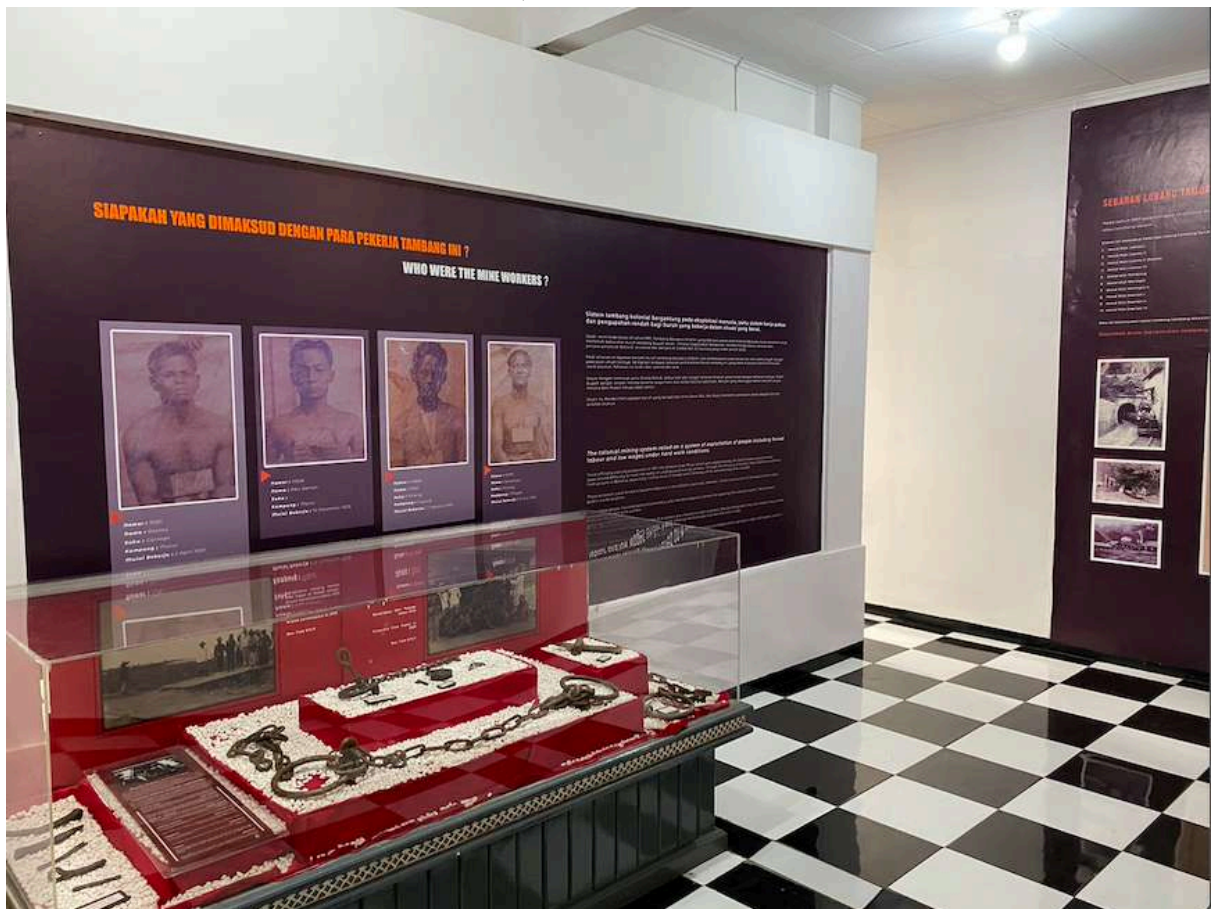
Galeri utama di Gedung Pusat Informasi Museum Situs Lubang Tambang Soero

Di galeri inilah orang rantai ditampilkan sangat deskriptif, punya nama, kampung asal, bahkan untuk orang Minang dicantumkan sukunya. Ini adalah pemanusiaan kembali orang rantai yang oleh Belanda didehumanisasi secara brutal dan dianggap statistik belaka. Kuburnya dipisah dari kubur pekerja lainnya, nisannya hanya diberi kode angka registrasi. Dengan kata lain, museum ini ingin memanusiaikan kembali orang rantai setelah mengalami dehumanisasi oleh rezim kolonial dan para penulis kolonial.