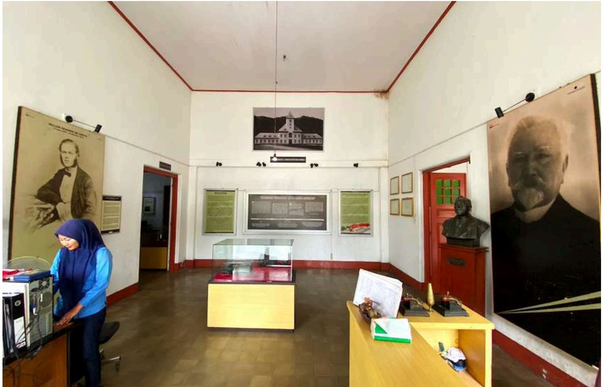
Ruang depan Museum Tambang Batubara Ombilin

Setelah memperkenalkan dua tokoh itu serta memberi penjelasan mengenai jenis-jenis batubara yang ditambang di Sawahlunto serta bedanya dengan batubara dari tambang-tambang lain di Hindia Belanda, pemandu mengajak ke ruangan arsip visual. Ini semacam mini teater dan pengunjung dapat menonton dokumenter pendek mengenai sejarah perkembangan Kota Sawahlunto, dari awal penambangan hingga dicanangkan menjadi Kota Wisata Tambang. Dokumenter ini menekankan pentingnya peran dan jasa tambang dalam sejarah Sawahlunto, bagaimana daerah persawahan yang awalnya lengang tak berpenghuni menjadi kota tambang yang jaya, merosot, dan berupaya bangkit lagi dengan segala potensi wisata tambangnya.